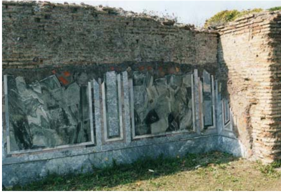
particolare dei marmi all'interno del Sacello degli Augustali.

Lasciatisi alle spalle il Teatro si prosegue per il decumano verso il foro , ma prima si devia a sinistra in corrispondenza di due cespugli sperando di ritrovare il sentiero che ci condurrà al Sacello degli Augustali (la zona è poco battuta e le indicazioni poco precise). Speriamo di avere il tempo e la fortuna di ritrovare questo luogo, molto bello e interessante per i mosaici che lì si trovano!