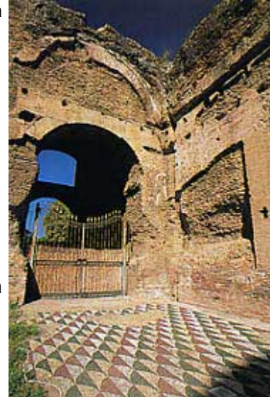
Veduta della palestra in cui spiccano il portico colonnato e il pavimento decorato a mosaico