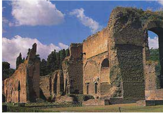
Veduta dell'esterno delle Terme di Caracalla

Ufficialmente chiamate Thermae Antoninianae , le Terme di Caracalla si trovano a Roma alle pendici dell'Aventino, fuori dall'antico centro abitato. Soltanto nella seconda metà del III secolo d.C., con la costruzione delle mura aureliane, esse furono integrate nella città, anche se rimasero sempre alla periferia. Nel VI secolo d.C. i Goti distrussero gli acquedotti e le misero così definitivamente fuori uso. Costruite per volere dell'imperatore Caracalla a partire dal 212 d.C., come dimostrano i bolli laterizi, le terme furono inaugurate nel 216 d.C., anno in cui venne completato il corpo centrale; i successori Elagabalo e Alessandro Severo ultimarono i lavori, aggiungendo il recinto esterno con le due imponenti esedre. Per l'alimentazione idrica delle terme, Caracalla fece costruire un nuovo acquedotto, l'Aqua Antoniniana, un ramo speciale dell'Aqua Marcia che oltrepassava la via Appia e confluiva nei grandi serbatoi situati dietro il recinto e nascosti da un'esedra di forma semiellittica.