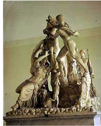
Copia marmorea del "Toro Farnese" rinvenuto nel Cinquecento

Esistevano inoltre tre sale all'interno delle due grandiose esedre sui lati del recinto, dove certamente si svolgeva un'attività importante di cui non rimane traccia. La sala absidata centrale era preceduta da un colonnato e dava accesso a due ambienti laterali, uno dei quali conserva ancora la forma ottagonale, coperta da una cupola. Qui, nei sotterranei, fu rinvenuto il mitreo più grande di Roma, a dimostrazione che nelle terme la gente s'incontrava anche per motivi religiosi. Un altro sistema di ambienti connessi fra di loro si trovava sotto il corpo centrale. Queste stanze non erano accessibili ai visitatori, ma soltanto al personale tecnico - dai portatori di legna ai fochisti fino agli addetti alla pulizia, quasi sempre schiavi - che garantiva il funzionamento ineccepibile delle terme. Tutto il personale veniva controllato dal balneator , che, oltre a essere responsabile di tutto l'impianto termale, aveva le mansioni degli attuali bagnini. Ancora al di sotto di questi primi sotterranei erano i vani per il drenaggio dell'acqua che confluiva al di fuori delle terme in una grande fogna.